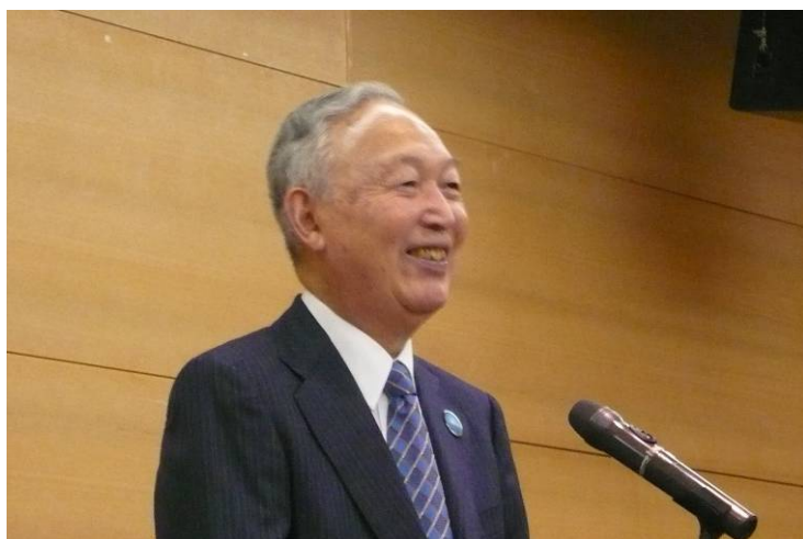
平成 25 年 5 月 18 日 ふじさんネットワーク総会での 開会挨拶