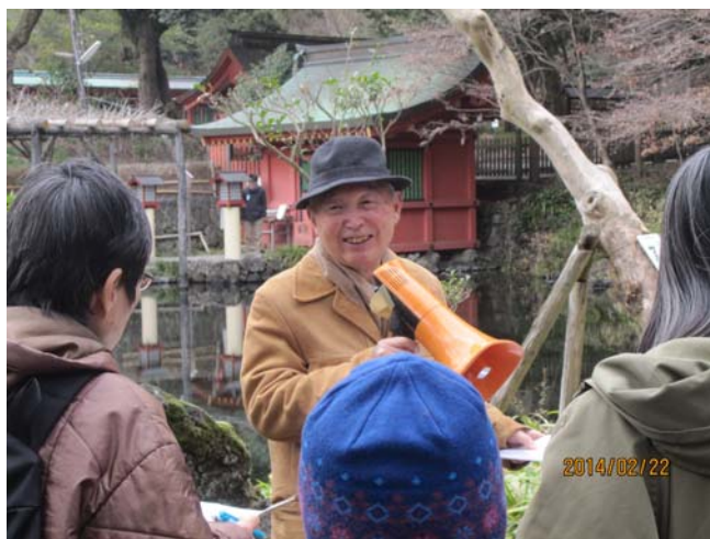
平成 26 年 2 月 22 日 白糸の滝・湧玉池自然観察会での 解説