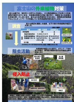
(外来植物対策展示)