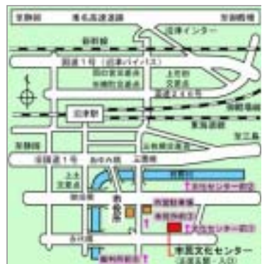
富士会場地図 沼津会場地図

両日とも、お申込・お問合せはふじさんネットワーク事務局まで、FAX又はEメールでお願いします。(連絡先は裏面下参照)