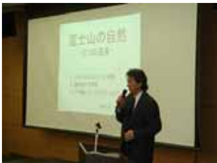
講演会:増沢静大教授 「富士山の自然 - 3つの遺産 -」