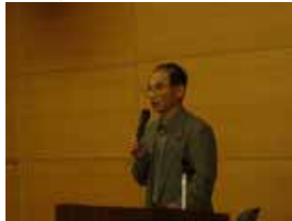
富士山世界文化遺産県民の会の説明