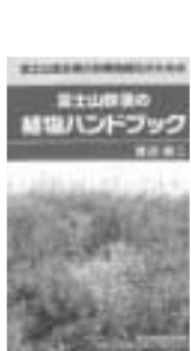
▲「身近な山野草・木の実」 定価/500円