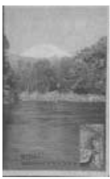
▲「柿田川の魅力」 定価/2,000円