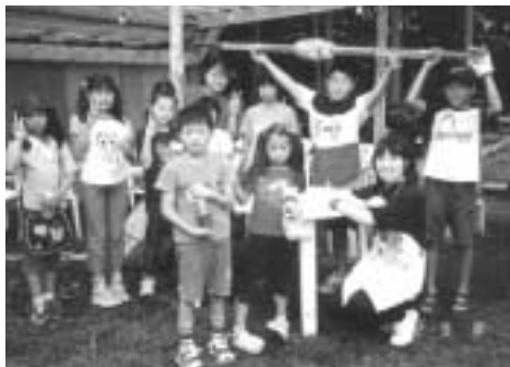
▲アウトドアクッキング (竹でバームクーヘン)

下期は、9月にスタート。 1. アウトドアクッキング・竹でバームクーヘンを焼こう 2. 富士山の森づくり、富士山に行って、バッコヤナギの枝を採集して、押し木。 3. 春植えたさつまいもを収穫し、焼き芋大会 4. 森へ柴刈り、森づくり 5. ネイチャークラフト 6. 命を学ぼうと富士山に自生する広葉樹の種まきを実施しました。今年は、何を行うか、今、スタッフが知恵をしぼっているところです。