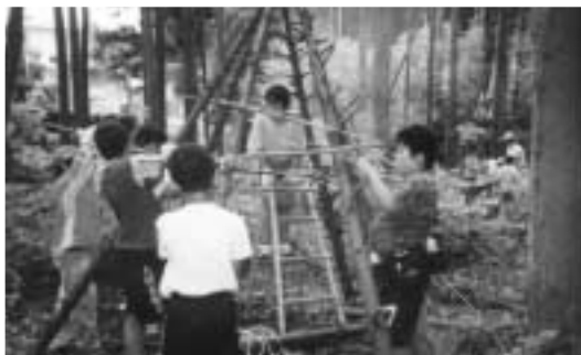
▲ネイチャークラフト

夏休みには、一泊二日の合宿プログラム。身のまわりのことは、なんでも自分でできるようになろう、ということで、山から竹を切ってきて、食器をつくり、食事は、飯盒炊飯で、自分たちでつくりました。ソーメンながしは好評でした。