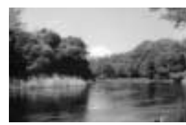
▲雪をいだいた富士山と春の柿田川