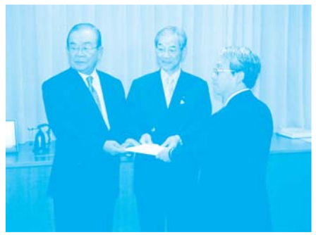
【「暫定リスト素案」を国に提出】

(※1 日本の世界遺産候補であることをユネスコに対して示すリスト。少なくとも登録推薦を行う1年前までにユネスコに提出する。)