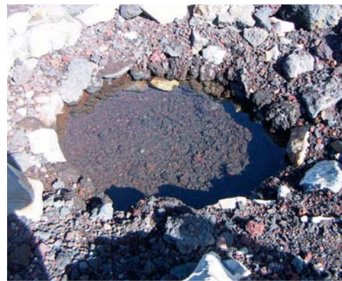
金明水付近にある水溜り

ふじさんネットワーク情報誌の表紙を飾る富士山の写真や、富士山で生きる動植物の写真を募集しています。これらの写真を御提供頂ける方は、ぜひ事務局まで御連絡下さい。