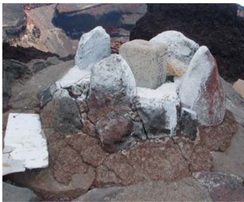
剣が峰にある二等三角点