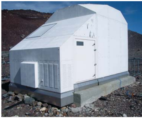
サブミリ波観測望遠鏡跡