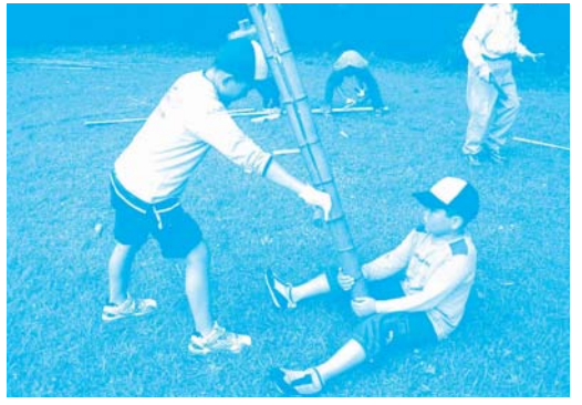
共同で竹を割っています