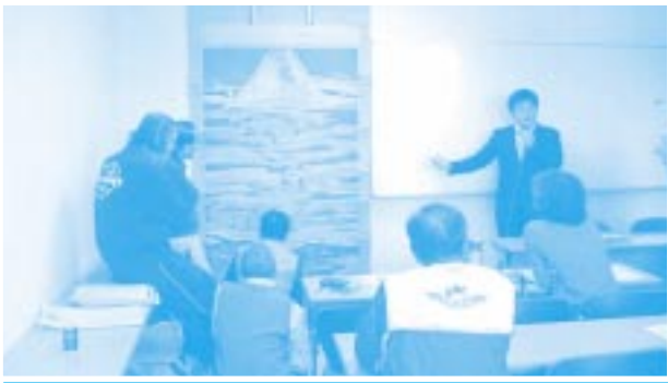
歴史関係の講座 浅間大社所有の富士曼荼羅図<重要文化財>