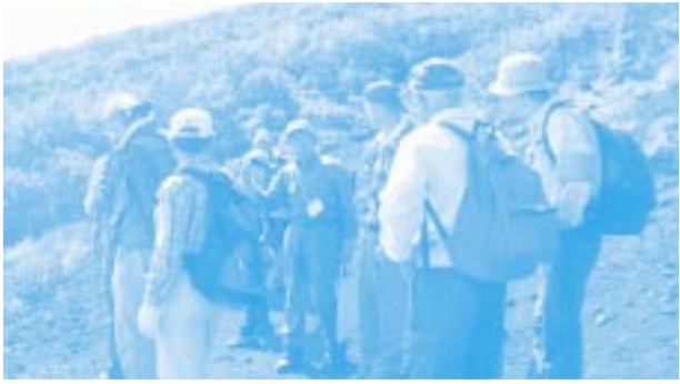
登山実践の現地講習 (須走口にて)