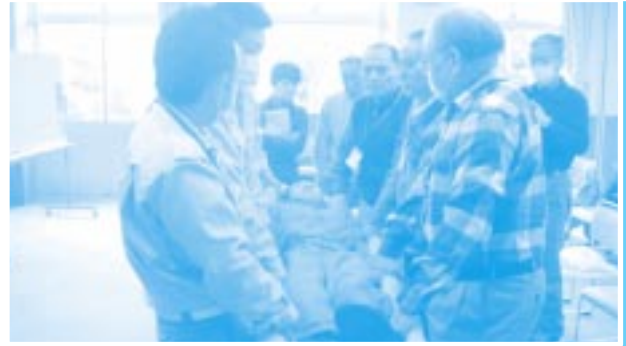
消防隊員による救急救命の実践 (毛布を使用した搬送法)