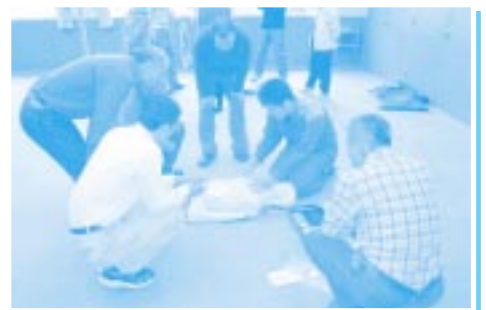
普通救命講習 (AEDの使用法)