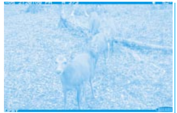
センサー・カメラに撮影された 5頭のニホンジカのグループ (須山口登山歩道周辺)