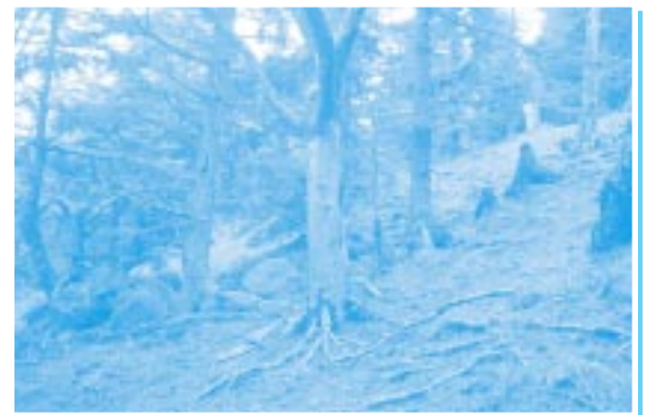
ニホンジカに樹皮を剥がされた ナナカマド (須山口登山歩道2.5合目下)