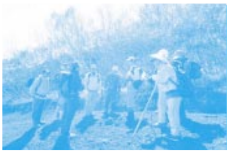
登山実践、救助法実践 (須走口六合目付近)