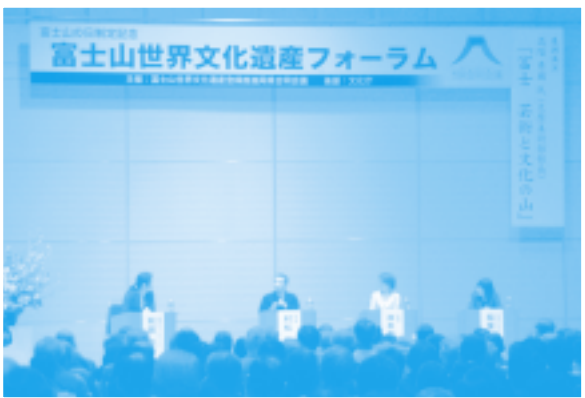
富士山の日制定記念 富士山世界文化遺産フォーラム(グランシップ)

さらに「富士山の日」を契機として、地域を学び、世界に誇る富士山を抱く静岡県だからこそ可能な、日本の地域づくりのモデル～富国有徳の理想郷“ふじのくに”～を創っていくことを目指しています。