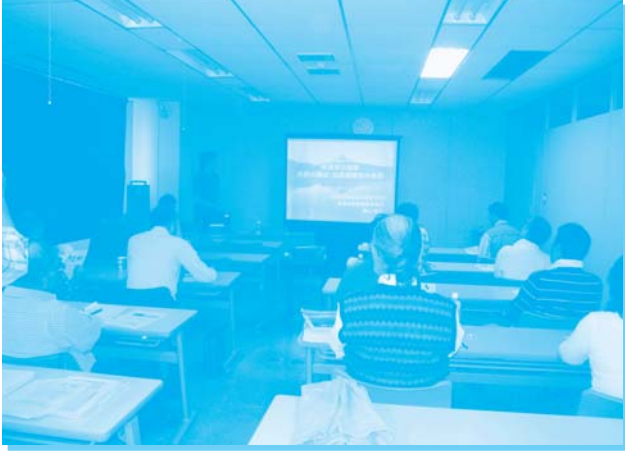
環境省施策の講義を受ける参加者の皆さん