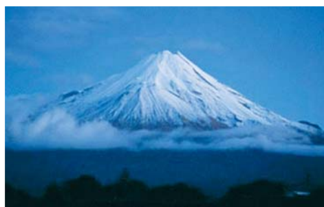
ニュージーランドのエグモント山 (2,518m)

この他にもニュージーランド・トンガリロ国立公園のナウルホエ山(2,291m)、USAのレーニア山(4,392m)、イタリアのエトナ山(3,290m)、グアテマラのアグア山(3,800m)などが有名な円錐形火山です。