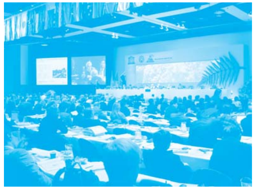
【第31回世界遺産委員会の審議の様子】

また、県では世界遺産委員会に2名の職員を派遣し、会場において富士山のDVDや絵はがき等を出席者に配布するなどして「富士山」のPRを行いました。