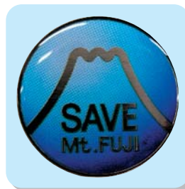
SAVE Mt.FUJI (大きさ:直径26mm)