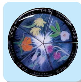
花シリーズ (5種) (大きさ:5個(セット)直径66mm)