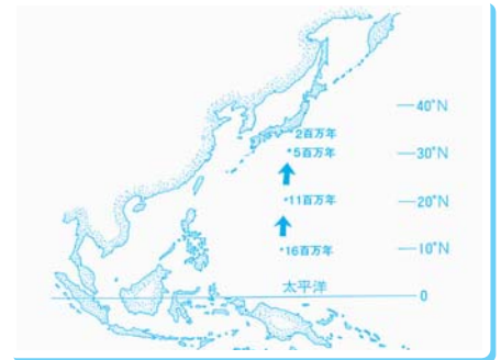
伊豆半島北進と静岡県東部への衝突