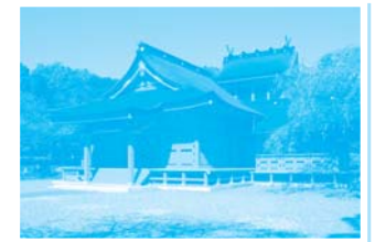
富士山本宮浅間大社