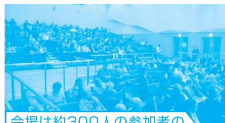
会場は約300人の参加者の熱気に包まれた