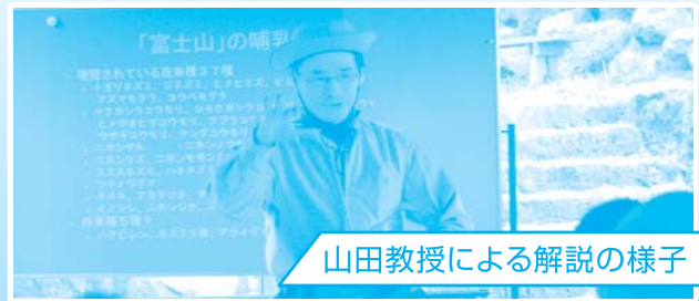
山田教授による解説の様子