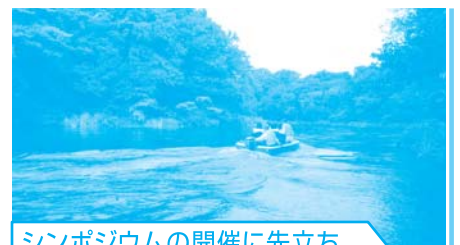
シンポジウムの開催に先立ち「柿田川」などの資産候補も視察