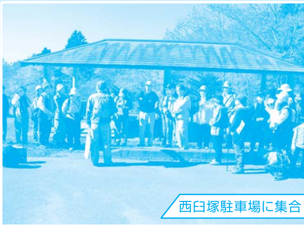
西臼塚駐車場に集合

西臼塚駐車場付近の、国有林内にある「富士山ふれあいの森林(もり)」を散策しながら、秋の自然林や人工林の様子を観察しました。