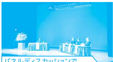
パネルディスカッションでさまざまな意見・提言がなされた