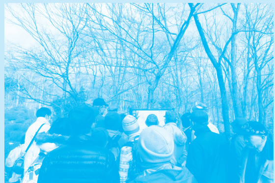
公園内の植生の見学