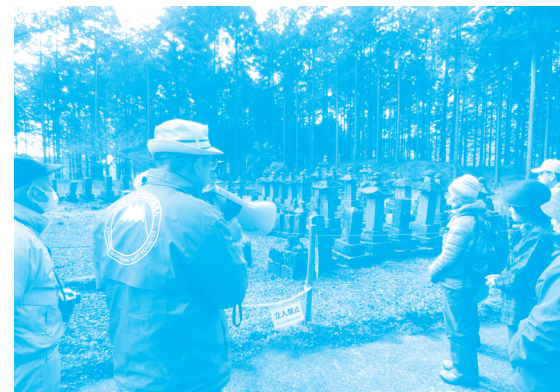
碑塔群と富士講による信仰の歴史の見学