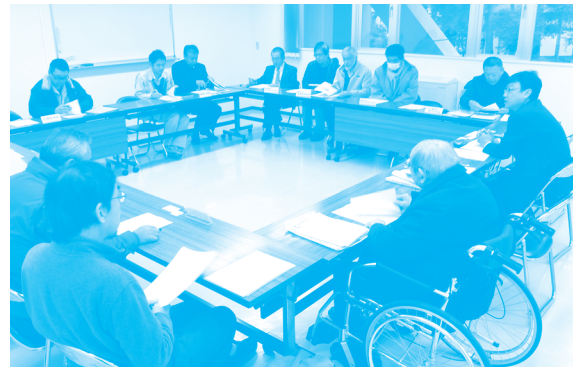
御殿場口五合目周辺における外来植物等に関する意見交換会

(参加団体)NPO法人富士山の森を守るホシガラスの会、NPO法人富士山ナショナルトラスト、NPO法人土に還る木・森づくりの会、富士山みどりの会、富士山自然誌研究会、御殿場ライオンズクラブ、静岡県(自然保護課)、御殿場市(環境課)、玉穂財産区