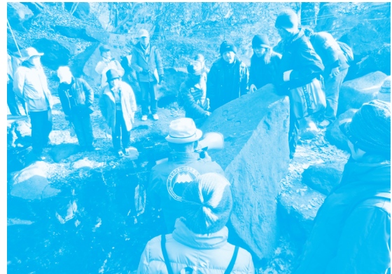
お鬢水と富士講碑文の見学