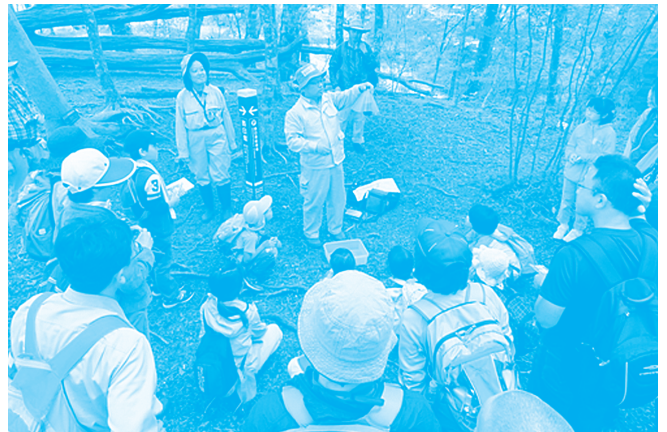
自然観察会の様子