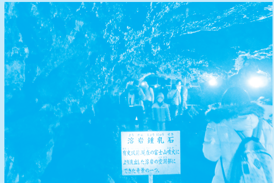
洞内の奇岩の様子