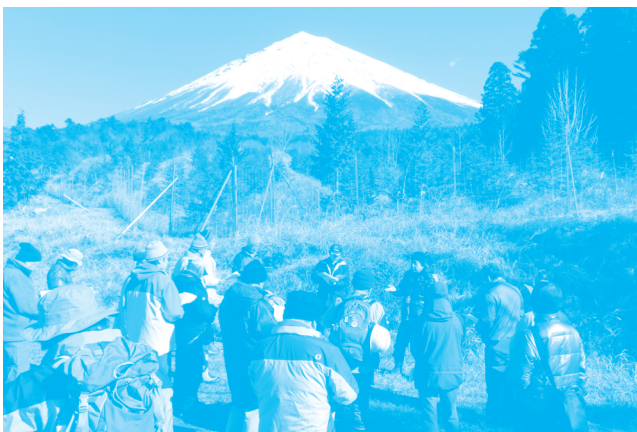
現地研修(国有林にて)

エコレンジャー活動にチャレンジしたい方は是非事務局までお問合せください。要望に応じ講習会情報等を御連絡いたします。