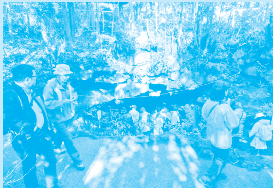
駒門風穴の巨大な入り口

超大型の溶岩洞窟である駒門風穴の洞内は照明が設置され、立って歩けるほどの天井の高さがありました。大広間のような大空間や、馬蹄の跡のような珍しい溶岩が観察でき、富士山の溶岩が生んだ創造物の巨大なスケールを実感することができました。