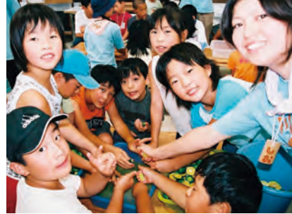
みかんの摘果を手伝い、捨てるみかんを特製ジュースに変える

元井戸エコアップ大作戦(5月)、ホテル観察会(6月)、 ビオトープ観察会(8月)、瀬戸谷まるかじり(11月)など