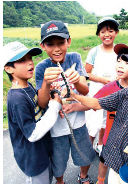
ヘビの扱いを覚える子ども達