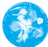
花シリーズ(5種) 大きさ:直径66mm(5個セット) 1口 1,000円以上