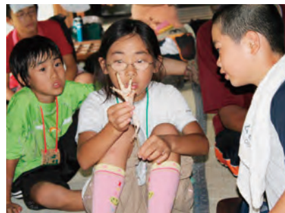
鶏をお肉にした後、腱を引っ張って、鶏の足でぐうちよきばあ