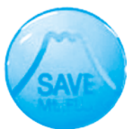
SAVE Mt.FUJI 大きさ:直径26mm 1口 300円以上