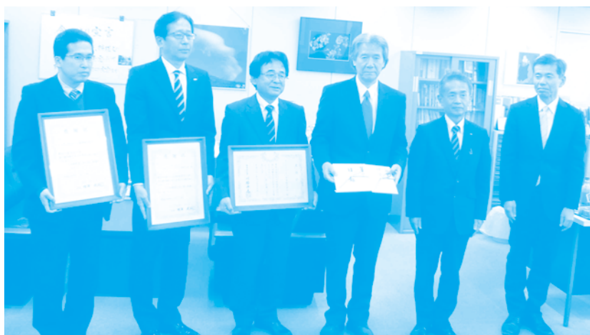
左から、マックスバリュ東海株式会社高畑環境・社会貢献次長、ハーゲンドッツ ジャパン株式会社小松名古屋支店長、マックスバリュ東海株式会社窪田総務部長、ふじさんネットワーク増澤会長、静岡県高木暮らし・環境部長、渡辺部長代理