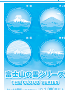
富士山の雲シリーズ THE CLOUD SERIES 1セット4個組(1セット1口) 1,000円以上