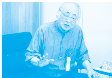
富士山の保全について、これまでの歩みを語る