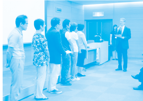
増澤会長からの励ましの言葉