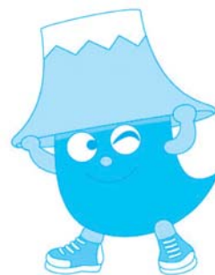
世界遺産 ふじっぴー