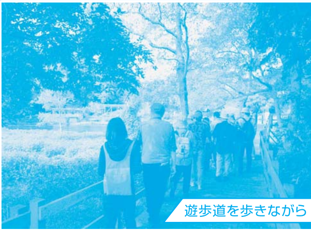
遊歩道を歩きながら

美しく澄んだ柿田川の流れを眺めながら、アオハダトンボ・ミシマバイカモ・ヒンジモなど、そこに生息する様々な貴重な動植物を観察することができました。