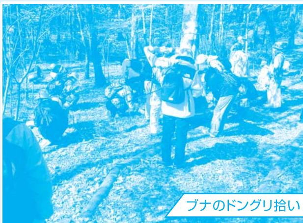
ブナのドングリ拾い

紅葉が美しい自然林の中で、樹木の解説などのほか、ドングリ拾いなども行いました。また、自然林復元活動の取組や、シカ食害の影響など、富士山の森の現状を「森の話」としてわかりやすく解説するなど、参加者の方々も興味深く耳を傾けていました。