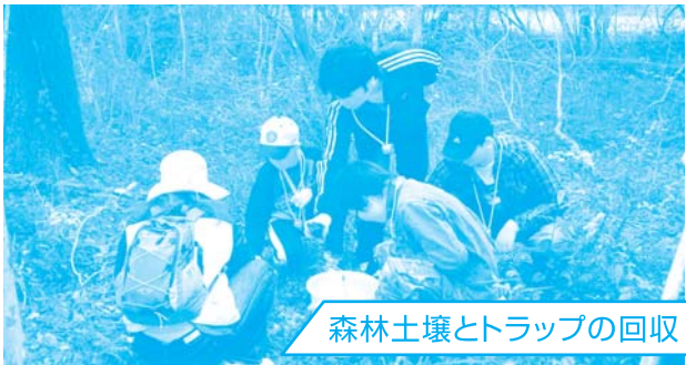
森林土壌とトラップの回収

富士常葉大学の協力で設置した、富士山麓に生息する「ヒメボタル」の幼虫捕獲用トラップと森林土壌を回収し、土壌生物を観察しました。