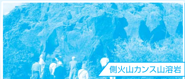
側火山カンス山溶岩

火山活動による溶岩流の影響や歴史など、詳しい解説とともに、実際に目で見て観察することで、参加者の方々も富士山の特徴的な自然を十分学ぶことができました。