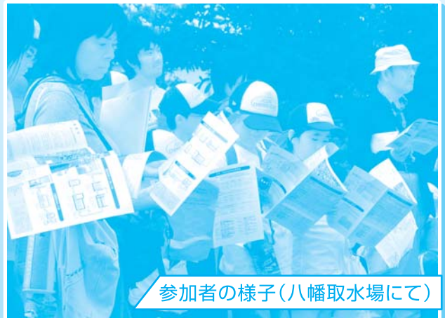
参加者の様子(八幡取水場にて)