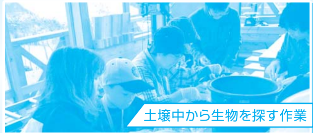
土壌中から生物を探す作業

ヒメボタルの幼虫を始め、数多くの土壌生物が観察され、富士山の森の豊かさを実感することができました。