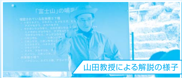
山田教授による解説の様子